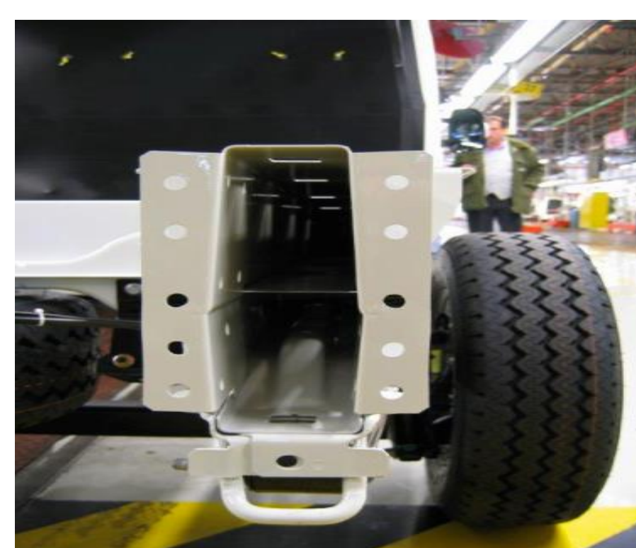
Подвійна рамна рейка "U"-типу.