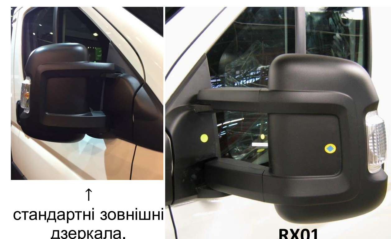
↑ стандартні зовнішні дзеркала.