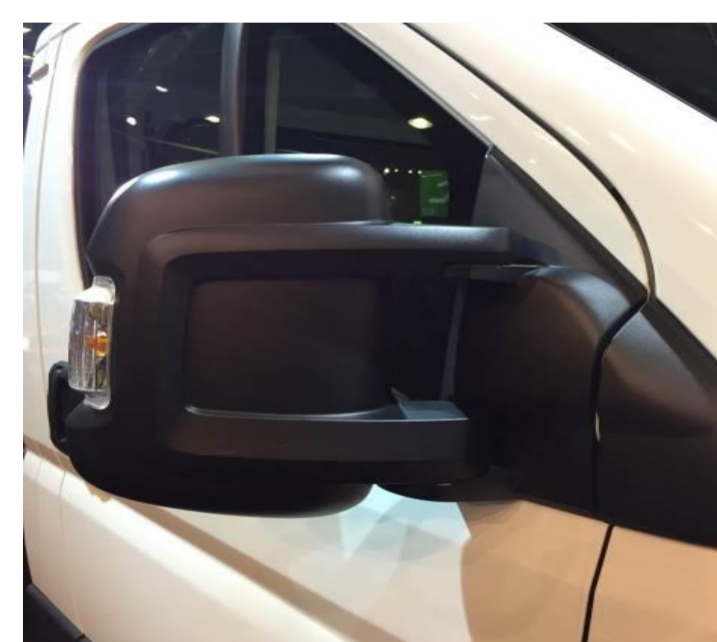
↑ стандартні зовнішні дзеркала.